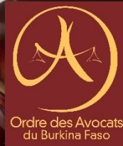
TABLEAU DE L'ORDRE DES AVOCATS ET LISTE DE STAGE

BARREAU DU BURKINA FASO 01 BP 1773 Ouagadougou 01 Tél. : 25 30 22 90/ 72 22 86 63 – Fax : 25 30 23 09 E-mail : info@barreau.bf